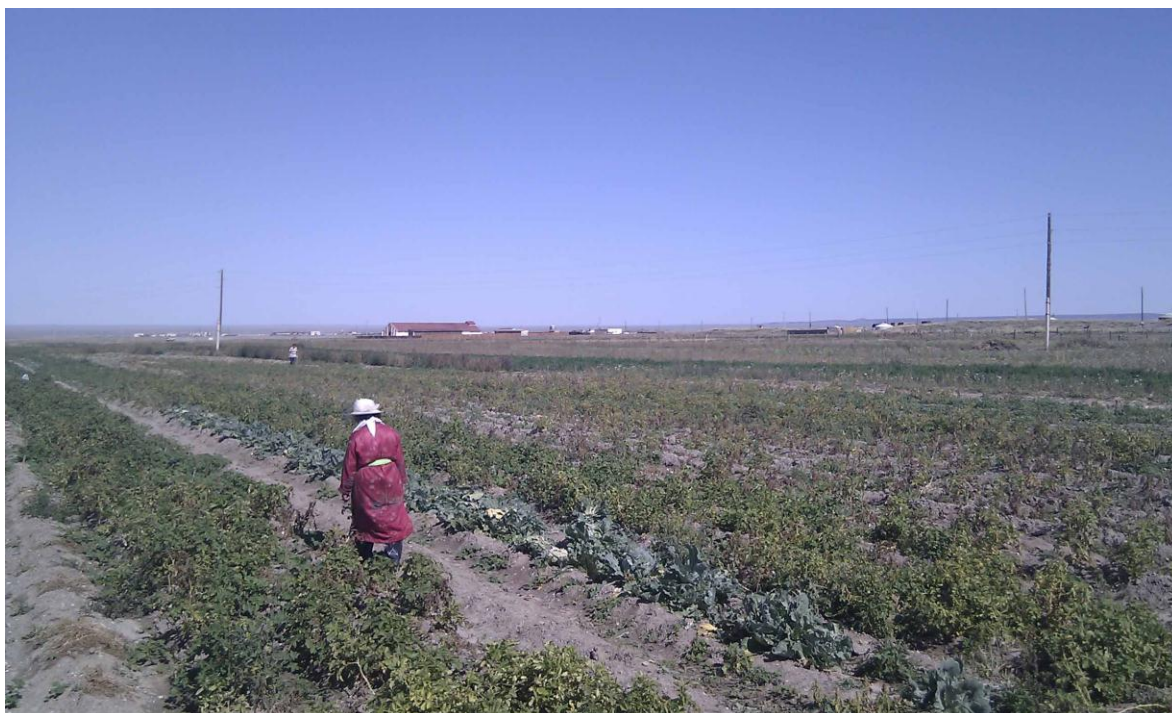
Зураг 9.2: Оюу Толгойн төсөлд хүнсний ногоо нийлүүлдэг Даланзадгад сумын ХАА-н хоршоолол