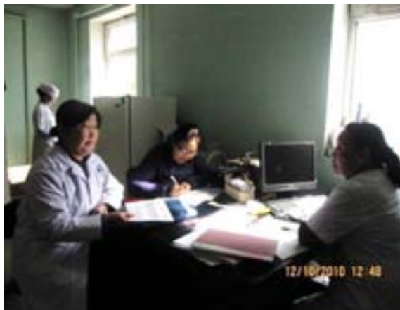
Эрүүл мэндийн нөөцийн үнэлгээний үеэр Даланзадгад. 2010.11.12