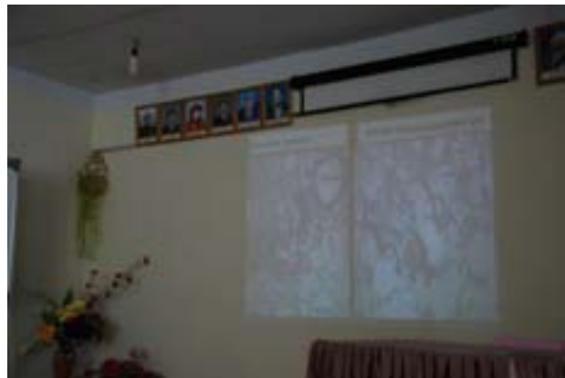
Эмчийн орон сууц хөтөлбөр

Оюу Толгой ХХК 2006 оноос эхлэн орон нутгийн эрүүл мэндийн салбарын үйл ажиллагааг дэмжих чиглэлээр Эмчийн орон сууц хөтөлбөр хэрэгжүүлж эхэлсэн бөгөөд 2007 онд Ханбогд, Ноён, Манлай, Булган, Баян-Овоо сумдад, 2008 онд Цогтцэций, Мандал-Овоо, Баяндалай, Сэврэй, Гурвантэс, Номгон сумдад эмчийн орон сууц баригдаж ашиглалтанд орлоо. Компани орон нутгийн бизнес эрхлэгчдийг дэмжих зорилгоор уг 11 суманд орон сууцыг орон нутгийн барилгын компаниудаар бариулах бодлого баримталсан бөгөөд Говь Гурван Сайхан компани 3, Гал Мөнх компани 2, Оршдос компани 2, Дэт компани 1, Даян Байгаль компани 3 сумдын барилгын гүйцэтгэгчээр тус тус ажилласан байна.