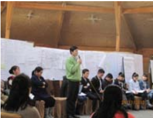
Даланзадгад . Зөвлөлгөөний үеэр