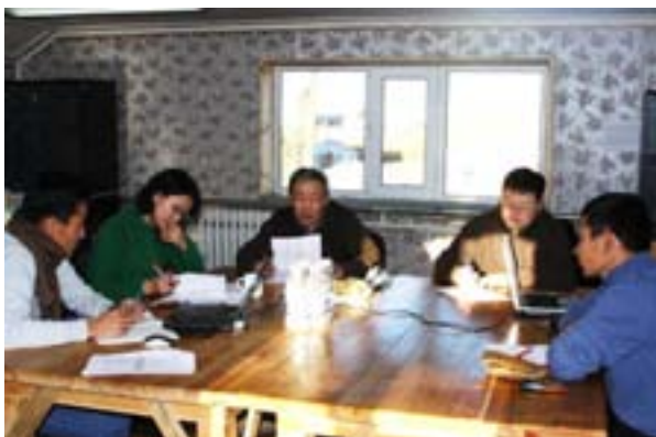
МБМХ-ны мэргэжилтнүүдтэй ярилцаж буй

Монголын Бэлчээрийн Менежментийн Холбоо нь Ханбогд сумын онцлог, нутгийн иргэдийн амьжиргаа, нөхцөл байдлыг тодорхойлох зорилгоор 2010 оны 9 сард Ханбогд суманд ажилласан бөгөөд Оюу Толгой ХХК хамтран ажиллах гэрээг 2010 оны 10 сард байгуулсан. Уг төслийн хүрээнд Ханбогд суманд бэлчээрийн менежментийг хэрэгжүүлэх, цаашид тогтвортой үргэлжлүүлэх зорилгоор “Ханбогд