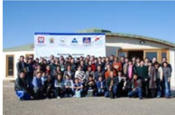
Манлай. Зөвлөлгөөнд оролцогчид