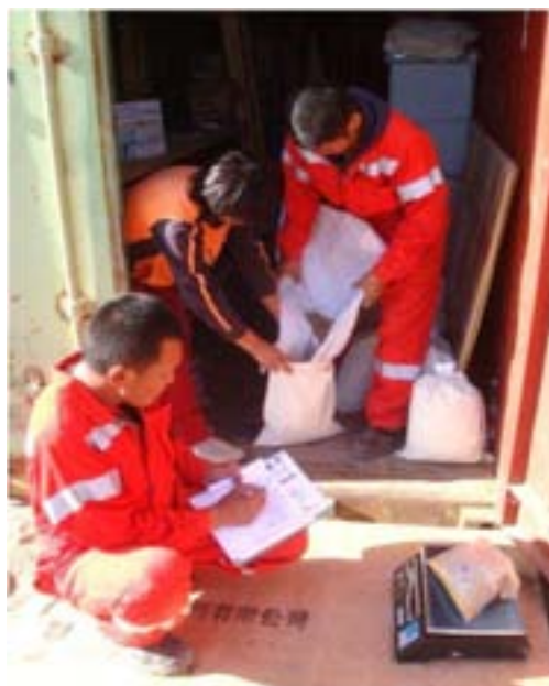
Манай ажилчид үр хүлээж авч буй нь

Оюу Толгой ХХК-ын Байгаль орчны хэлтсээс 2010 онд төслийн үйл ажиллагаагаар хөндөгдсөн газруудад биологийн нөхөн сэргээлт хийхэд нутгийн ургамлын үрийг ашиглах санаачлага гаргасан. Бид энэхүү санаачлагыг дэмжин Байгаль орчны хэлтсийн мэргэжилтнүүдийн зөвлөмж, сумдын ажилтнуудынхаа дэмжлэгээр Манлай, Ханбогд сумын нутгаас баглуур, бор бударгана, бүйлс, шар модон хотир зэрэг 12 төрлийн ургамлын үрийг 2010 оны 9-11-р сарын хооронд орон нутгийн иргэдийн хүч, оролцоотойгоор түүж цуглуулах ажлыг амжилттай зохион байгууллаа. Энэ нь ОТ төслийн байгаль орчны үйл ажиллагаануудад орон нутгийн иргэд, малчдыг оролцуулсан анхны ажил болсон юм. Эхний удаад нийт 137.5 сая төгрөгийн өртөг бүхий 10.3 тонн нутгийн ургамлын үр цуглуулж Байгаль орчны хэлтсийн биологийн нөхөн сэргээлтэд зориулсан үрийн фондод хүлээлгэн өглөө.