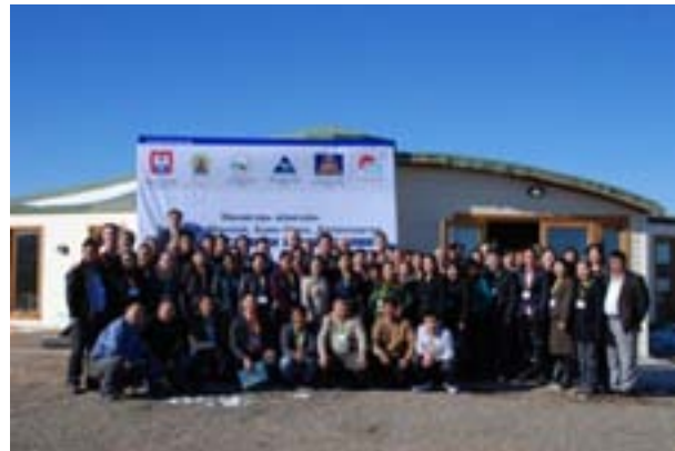
Ханбогд. Зөвлөлгөөнд оролцогчид

Энэхүү зөвлөлгөөний зорилго нь уул уурхай, дэд бүтцийн салбар эрчимтэй хөгжиж буй өнөө үед нөлөөллийн бүсийн хөгжлийн хэтийн ирээдүйг орон нутгийн иргэдийн оролцоотойгоор тодорхойлох, нэгдсэн ойлголтод хүрэх, улмаар ирээдүйн үйл ажиллагааг өөрсдөө төлөвлөхөд оршино. Мөн зөвлөлгөөний үр дүн нь Монгол Улсын Ашигт малтмалын хуулийн 42-р зүйлийг хэрэгжүүлэх суурь болох юм. Энэхүү зөвлөлгөөнд эрүүл мэнд, боловсрол, бизнес, нутгийн захиргаа, малчид, иргэний нийгмийн байгууллагын төлөөлөл бүхий 70 орчим иргэд оролцов. Оролцогсод сум орон нутгийнхаа өнгөрснийг цэгнэж, өнөөг ярилцаж, ирээдүйг төсөөлөн сумын хэтийн хөгжлийн үндсэн чиг баримжааг тодорхойллоо.