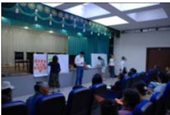
Даланзадгад. Сургалтын үеэр

Оюу Толгой ХХК-ий Хангамжийн хэлтэс нь “Canadian Energy Consultancy” компанитай хамтран Даланзадгад сумын хүнсний ногоо тариалагч иргэд, аж ахуйн нэгж байгууллагуудыг чадваржуулах, цаашид Оюу Толгой ХХК-д ногоо нийлүүлэх боломжийг судлах зорилгоор Өмнөговь аймагт 2010 оны 5 дугаар сарын 31-нээс 2010 оны 6 дугаар сарын 3-ны өдрүүдэд сургалт болон судалгааны ажлыг зохион байгууллаа.