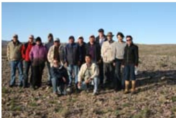
Соёлын өвийн хөтөлбөрийг боловсруулах зөвлөх баг