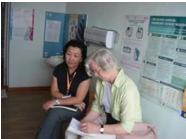
Мэдээ, баримт цуглуулах үеэр Ханбогд. 2010.07.29

тодруулах, орон нутгийн судалгааны баг юуг төвлөрч судлах зэрэг асуудлыг тодорхойлоход чухал ач холбогдолтой болсон.