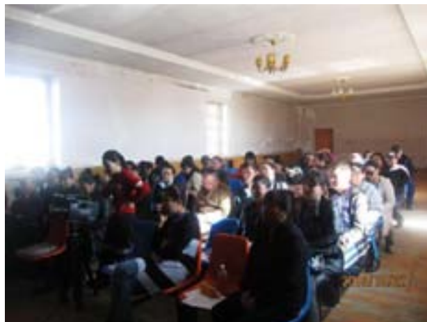
Сумын иргэдийн уулзалт Манлай. 2010.10.21