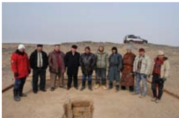
Судалгааны ажилтай Ханбогд сумын захиргааны ажилтнууд танилцаж буй нь

Зөвлөх ажил нийт 12 сарын хугацаатай бөгөөд эхний шатанд ОТ төслийн нөлөөллийн бүсийн Ханбогд, Манлай, Баян-Овоо, Даланзадгад сумд болон