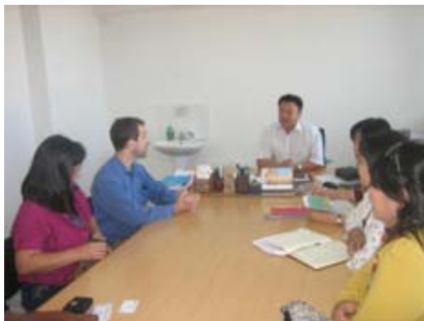
Аймгийн НЭ-ийн удирдлагатай хийсэн уулзалт Даланзадгад. 2010 оны 8-р сар